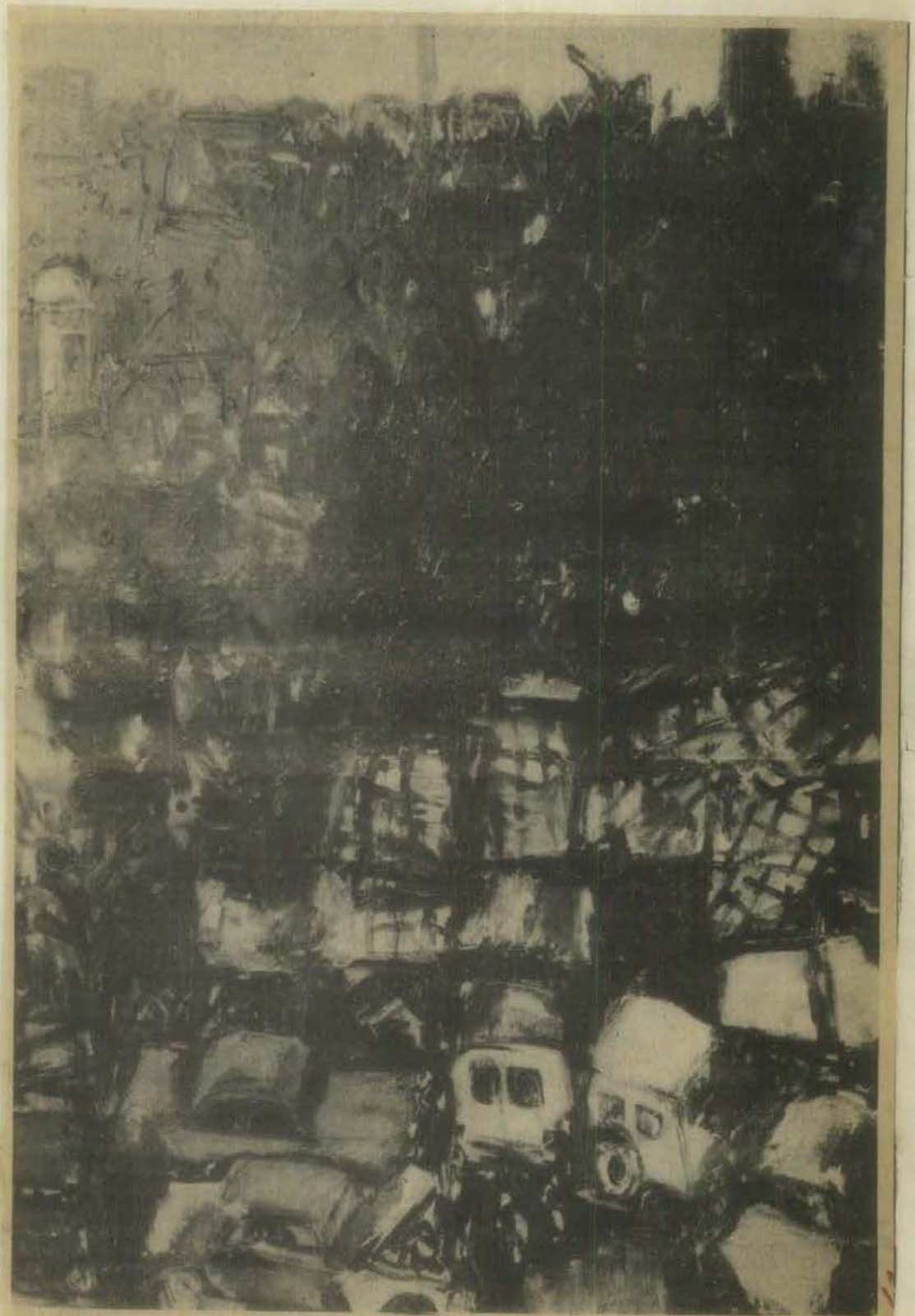
Lukisan "Kota" karya Srihadi